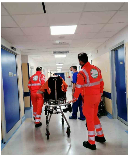
L'arrivo di un paziente al pronto soccorso

Ora, ultimati i lavori, si riprende un'attività, parte integrante dell'offerta sanitaria di un ospedale che si conferma struttura per acuti, con una vocazione alla gestione dell'urgenza. «Un punto di riferimento irrinunciabile - come spiegato dal direttore generale di Asst Brianza, Marco Trivelli - per un territorio con oltre 60mila abitanti. Per questo si è investito per l'ammodernamento strutturale e tecnologico del presidio, a partire proprio dal pronto soccorso». I lavori progettati e realizzati migliorano, dal punto di vista strutturale e organizzativo, la presa in carico dell'utenza afferente al pronto soccorso. Le opere eseguite hanno preso corpo sia in corrispondenza dell'ingresso, sia in quella degli spazi interni dedicati