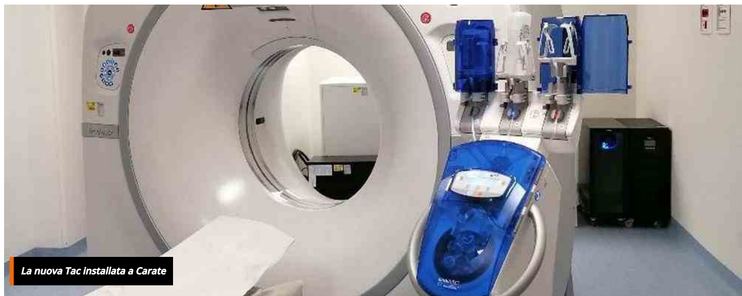
La nuova Tac installata a Carate

HOME / CRONACA / RIAPERTO IL PRONTO SOCCORSO DI CARATE BRIANZA DOPO I LAVORI (E CON UNA NUOVA TAC)