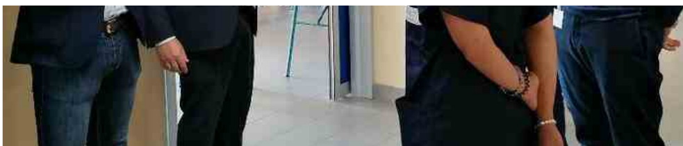
Un momento dell'inaugurazione con le autorità politiche