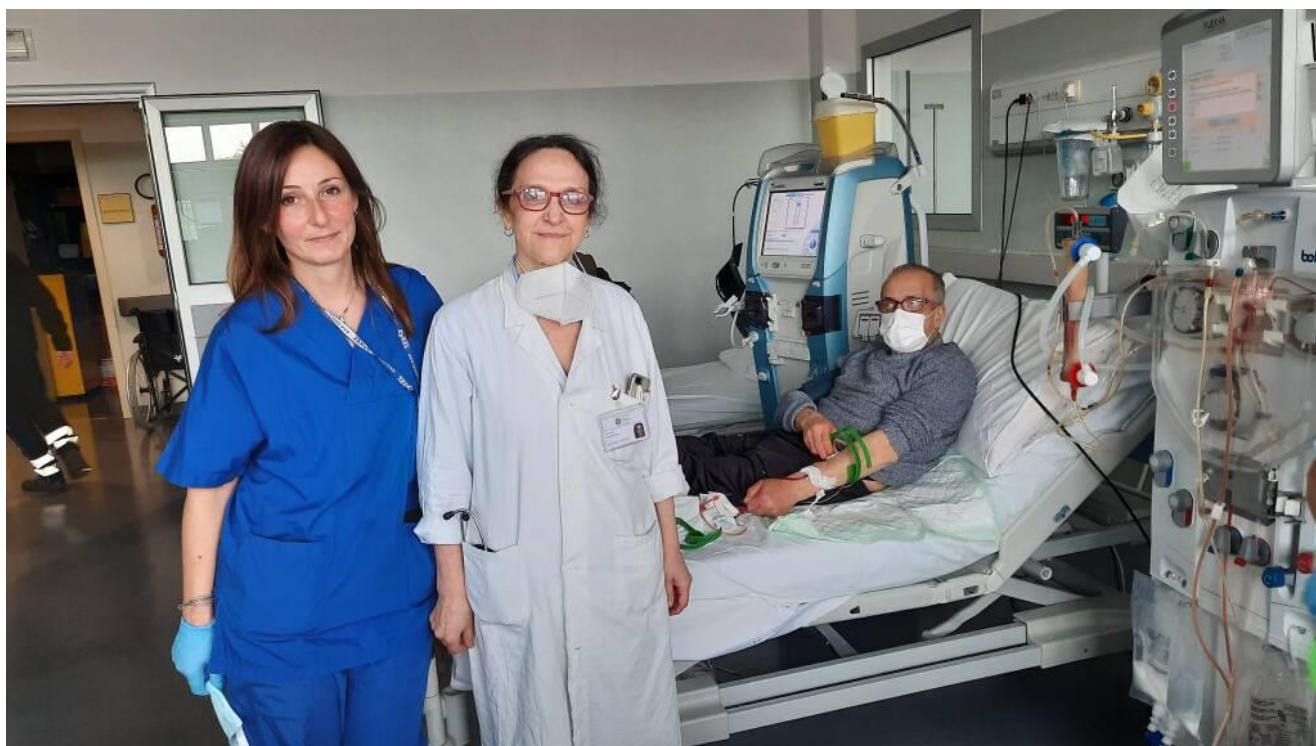
Nefrologia e Dialisi dell'Ospedale di Vimercate

I pazienti sono persone affette da insufficienza renale, nei diversi stadi: dal più moderato a quello terminale.