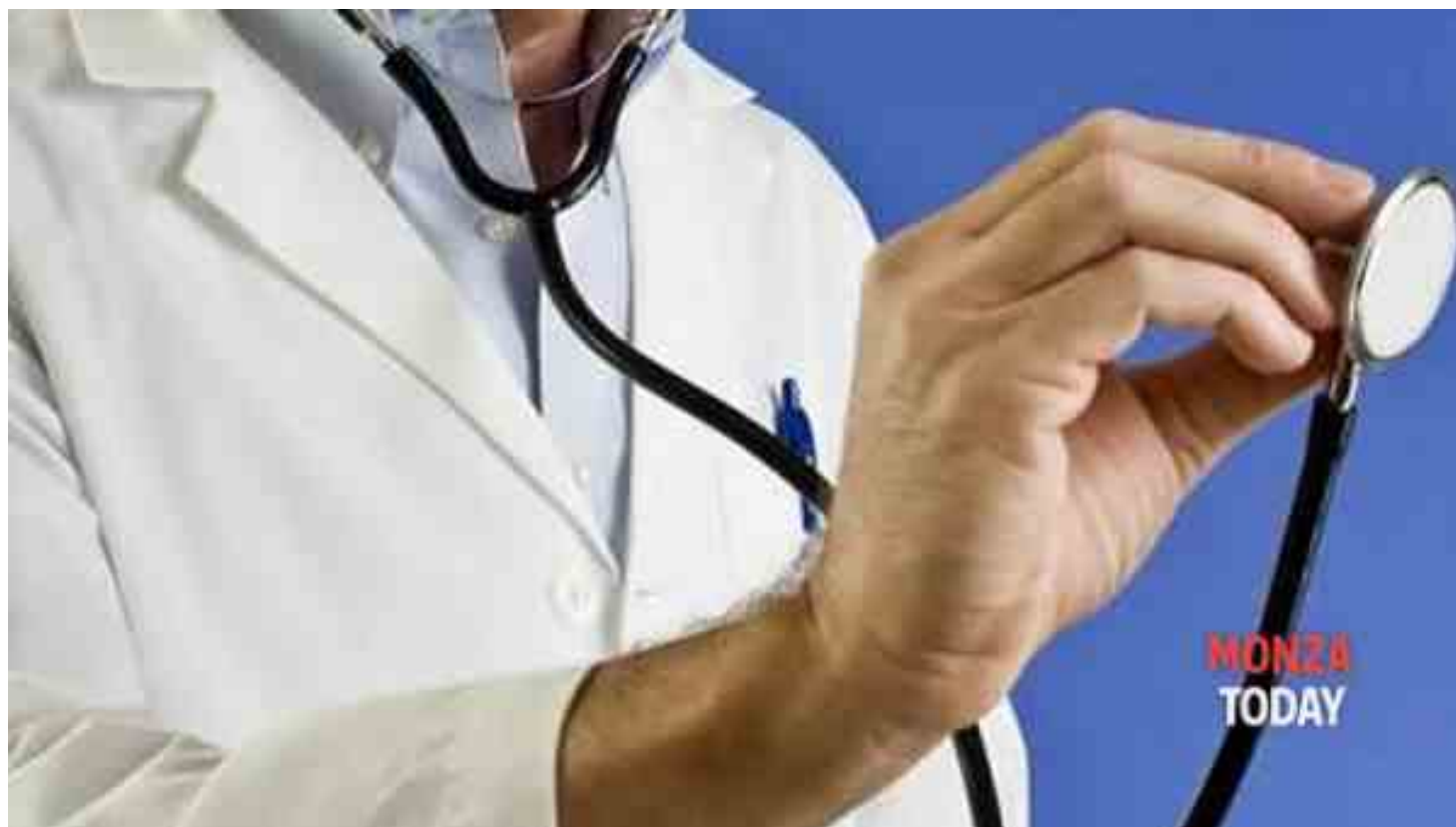
Immagine di repertorio

I l 19 e il 21 giugno la struttura di Riabilitazione Pneumologica dell'ospedale di Seregno promuove un evento finalizzato alla sensibilizzazione sulla prevenzione delle patologie respiratorie. Gli specialisti del presidio di via Verdi saranno a disposizione di pazienti e popolazione interessata e con diagnosi di asma bronchiale, per una visita pneumologica e un test spirometrico.