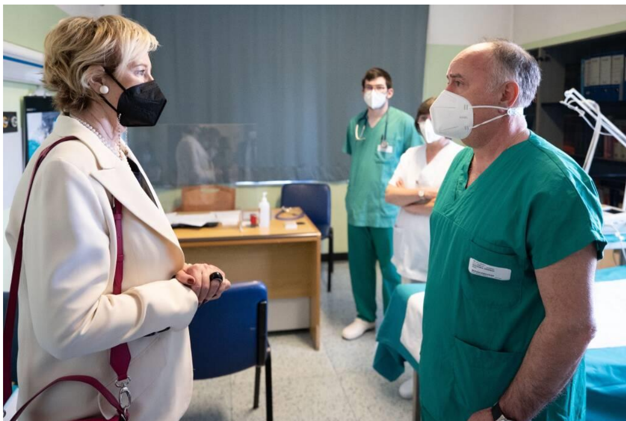
Ambulatorio di Cardiologia dell'Ospedale di Comunità di Giussano

Si articola ulteriormente l'offerta di monitoraggio sanitario a distanza di pazienti afferenti all'Ambulatorio di Cardiologia dell'Ospedale di Comunità di Giussano.