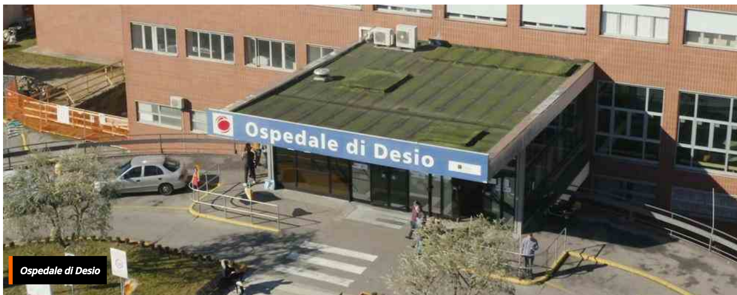
Ospedale di Desio

HOME / CRONACA / OSPEDALE DI DESIO, NOVITÀ PER LA RADIODIAGNOSTICA