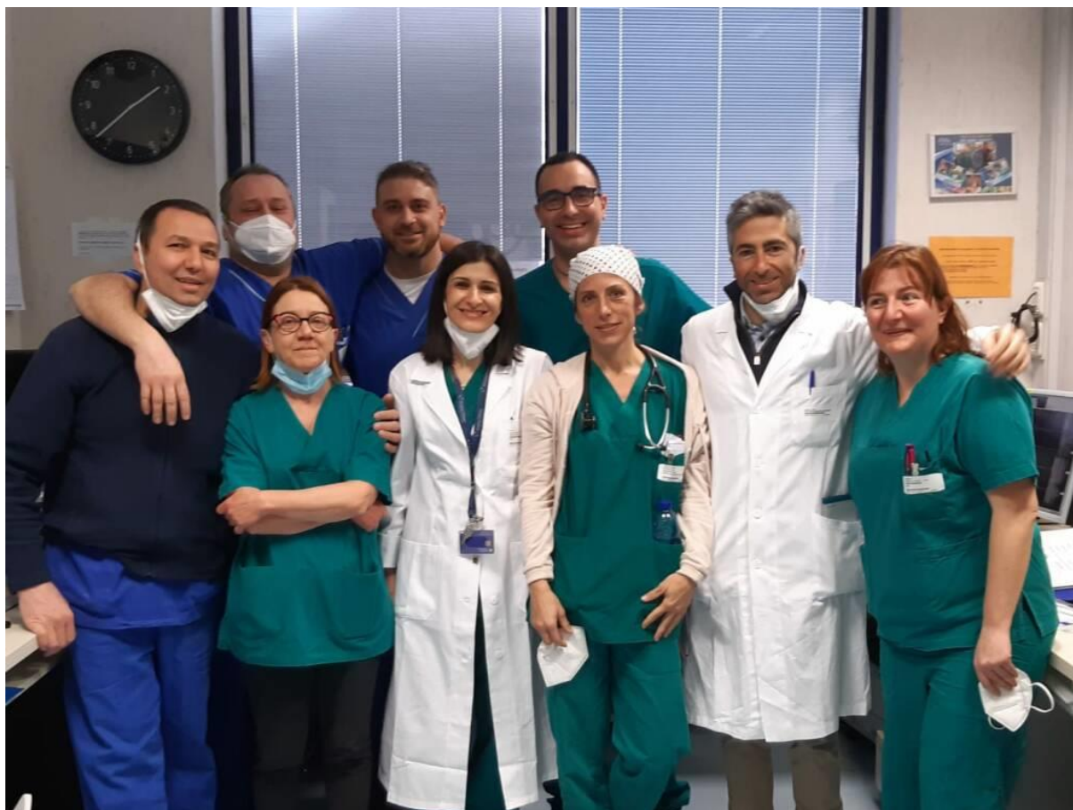
Il team di elettrofisiologia a Desio

Desio. Cambio di passo all'Ospedale Pio XI di Desio: dal dicembre scorso, la struttura di Cardiologia , acquisito un sistema tecnologico adeguato, ha avviato l'attività di elettrofisiologia interventistica che si aggiunge alla consolidata esperienza relativa all'elettrostimolazione tradizionale. L'elettrofisiologia interventistica consente la "terapia chirurgica" delle aritmie attraverso tecniche di ablazione eseguite attraverso cateteri che utilizzano metodi diversi (radiofrequenza, crioablazione etc).