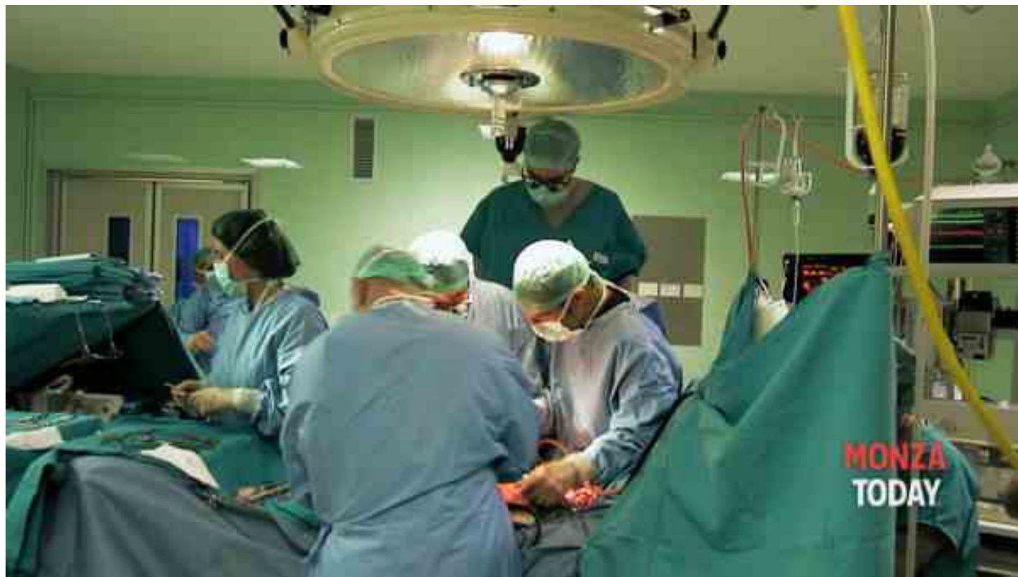
Immagine di repertorio

P er loro la scienza non aveva dato speranze: avevano metastasi epatiche causate da un cancro al colon-retto definito inizialmente non operabile. Ma per il 24% di loro, grazie a cicli specifici di chemioterapia, la condizione è stata riportata alla fase di trattamento chirurgico curativo, sia per il fegato sia per l'altra forma tumorale.