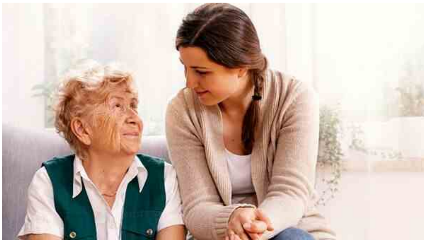
Immagine di repertorio

S i tratterà di un ciclo di 4 incontri con esperti per imparare a prendersi cura dei propri familiari anziani o malati.