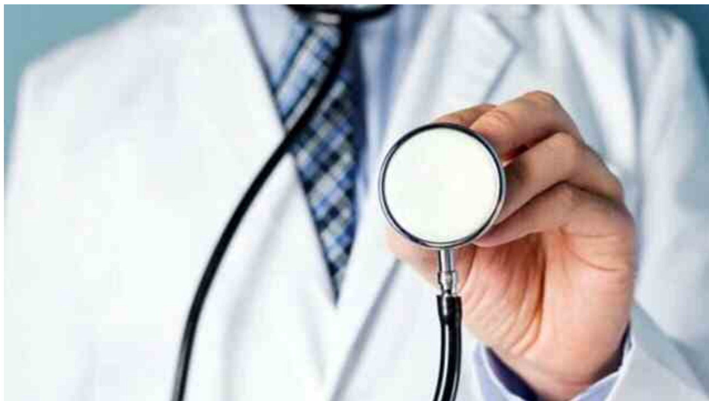
Immagine di repertorio

Consulenze cardiologiche gratuite nella casa di comunità di Giussano e all'ospedale di Vimercate. Anche quest'anno l'Asst Brianza partecipa all'iniziativa nazionale 'Cardiologie aperte' promossa dalla Fondazione per il Tuo Cuore, l'ente di ricerca dell'ANMCO (Associazione nazionale dei medici cardiologi ospedalieri). I cardiologi dell'ospedale di Vimercate saranno a disposizione il 13, 14 e 16 febbraio dalle 14 alle 16, quelli della casa di comunità di Giussano il 17 febbraio, sempre dalle 14 alle 16. Le persone interessate hanno a disposizione un numero verde dedicato e gratuito, l'800 052233, attraverso cui prenotare un appuntamento telefonico.