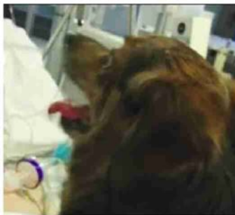
Bubu sul letto della Terapia intensiva

Per la prima volta l'ospedale ha aperto le visite ad un cagnolino