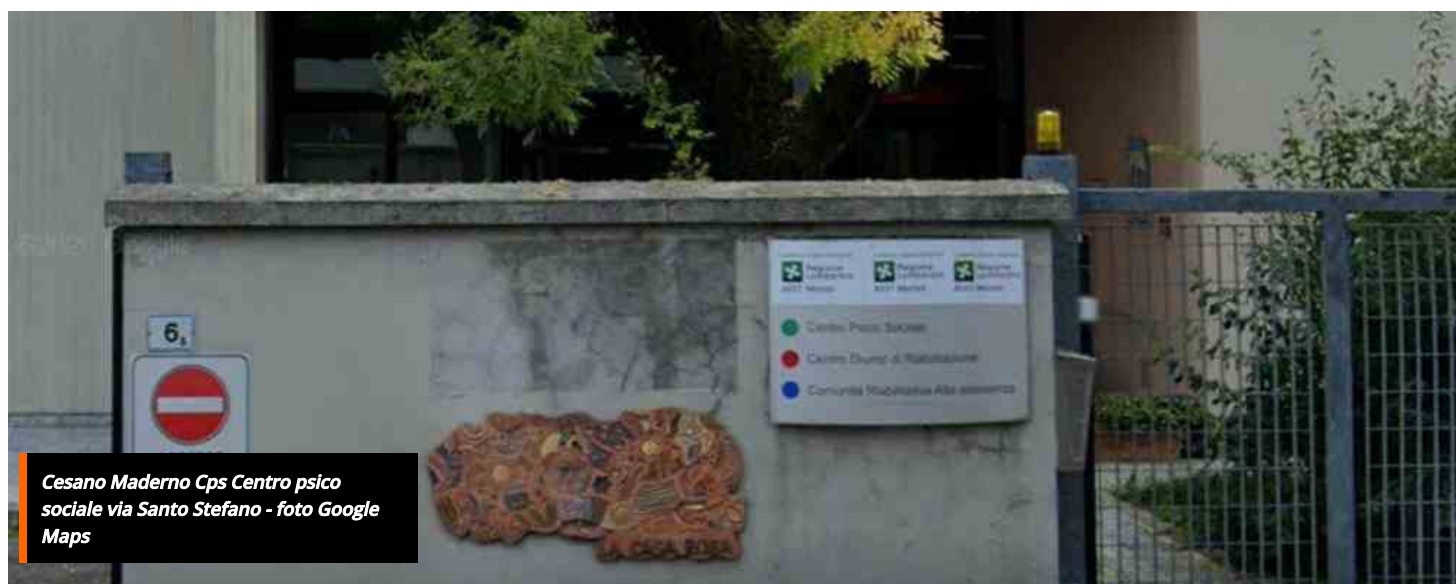
Cesano Maderno Cps Centro psico sociale via Santo Stefano

HOME / CRONACA / IL CENTRO PSICO-SOCIALE DI CESANO MADERNO CERCA VOLONTARI: 1.500 UTENTI IN CARICO, 550 RICHIESTE D'AUTO NELL'ULTIMO ANNO