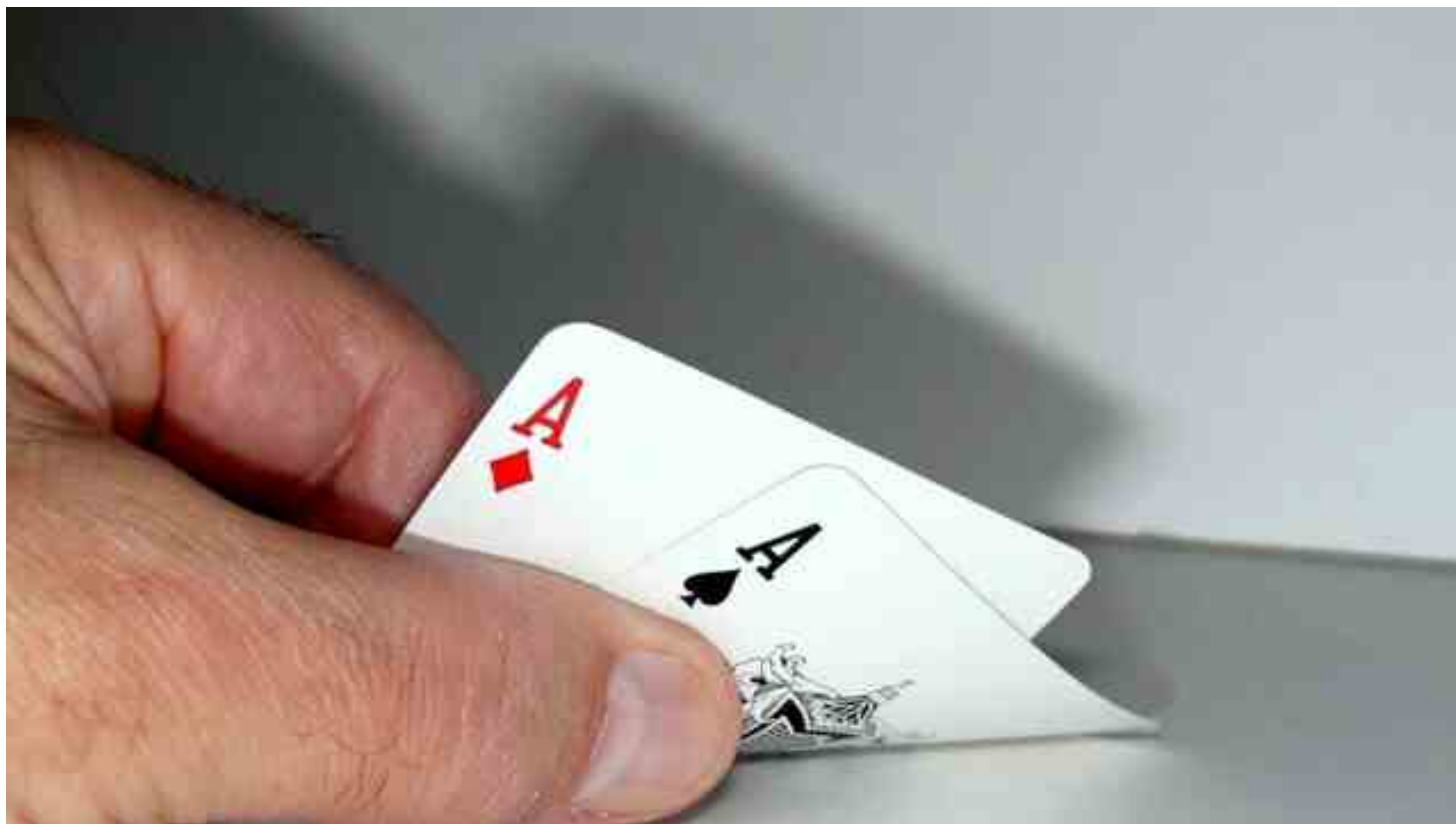
Immagine di repertorio

Quasi cittadino su 10 - secondo alcune rilevazioni - abusa del gioco e lo trasforma in una “malattia”. Il disturbo da gioco d'azzardo colpisce il 2% della popolazione. La ludopatia, come l'alcol o la droga, è una dipendenza. E per offrire un supporto a chi ne soffre in Brianza arrivano due punti di ascolto. Prendendo in osservazione l'arco di tempo dal 2016 a oggi, gli utenti con problemi di gioco d'azzardo presi in cura a livello ambulatoriale dai servizi di ASST Brianza sono andati crescendo fino al 2019, raggiungendo un picco di 146 all'anno. C'è poi stato un calo, in seguito alla pandemia, seguito da un nuovo aumento fino ai 136 utenti annui attuali, di cui 58 nuovi casi.