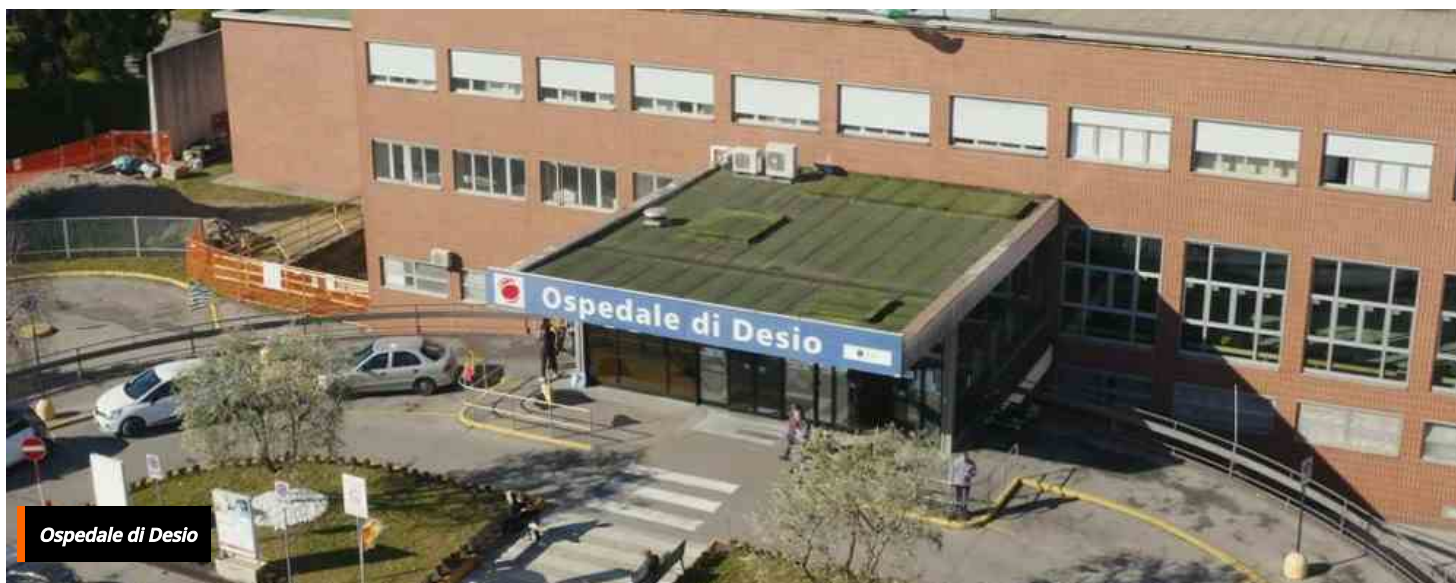
Ospedale di Desio

HOME / CRONACA / NOVITÀ PER L'OSPEDALE DI DESIO: PRONTO SOCCORSO DA AMPLIARE SU 2MILA METRI QUADRI, POSTI LETTO COME A VIMERCATE